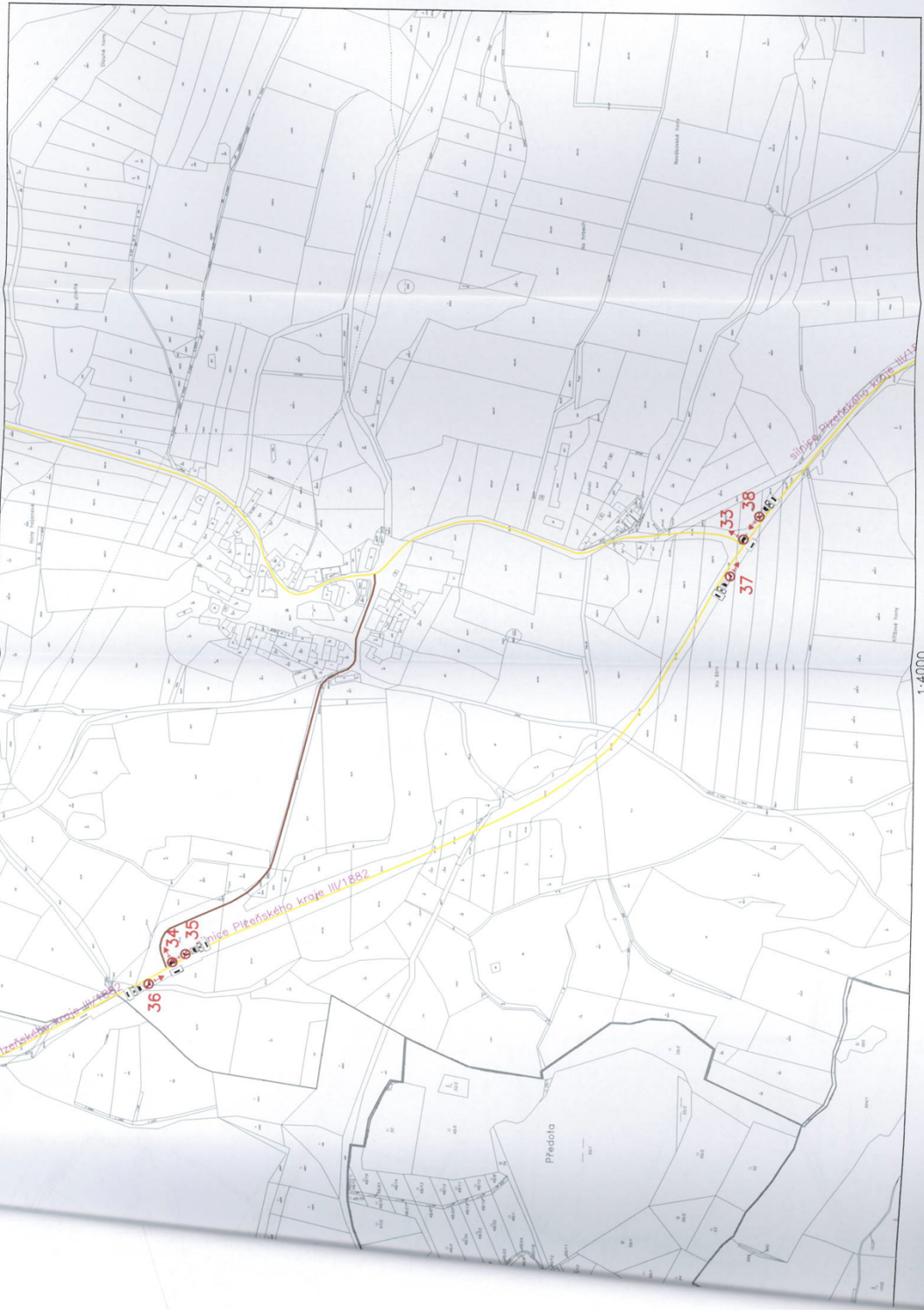
DIO Chanovice — II. etapa — mapa č.8