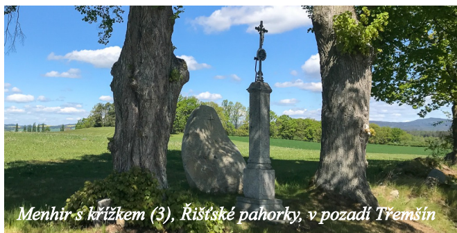
Menhir s křížkem (3), Řištské pahorky, v pozadí Třemšín

Výchozím i cílovým bodem základního okruhu bude náves v Zahorčicích. Zaparkovat je možné v odbočce k zemědělskému objektu (9). Na zahorčické návsi (1) se nachází kaplička sv. Jana Nepomuckého a Panny Marie, kříž s letopočtem 1886, pomník padlým ve světových válkách a panel prvního zastavení naučné stezky. Na severním okraji Zahorčic odbočíme před restaurovaným křížem z roku 1907 vpravo na asfaltku, která nás přivede k rybníku V Chalupách (2). Po 140 metrech přijde rozcestí. Asfaltová cesta se stáčí vlevo a pokračuje k vrcholu (3). Zde uvidíme dvě staleté vitální lípy a žulový šestitunový menhir s vytesaným křížkem a letopočtem 2017 a na vysokém