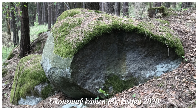
Ukousnutý kámen (8): květen 2020

U kraje lesa odbočíme vpravo a jdeme severně k dalšímu