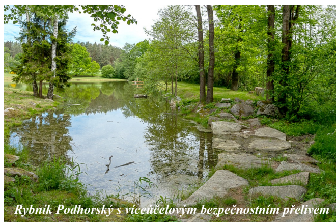
Rybník Podhorský s víceúčelovým bezpečnostním přelivem

podobnou funkci, jako přeliv rybníka Nadýmače v Mračovsko-pálenecké rybníční soustavě. Stokou od něj vedenou napájí rybníky Starý a Kozedře. Poté, co se vrátíme na rozcestí, přejdeme nejprve výtok z požeráku Podhorského a pak pokračujeme podél lesa, jehož okrajem je vedena zmíněná stoka. Po přejití stoky vyjdeme na silnici pod firmou Haas.