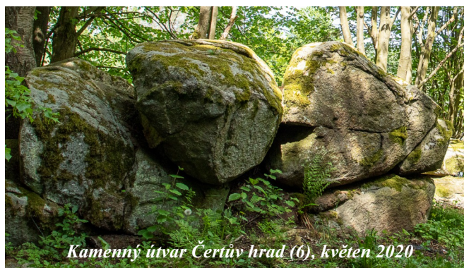
Kamenný útvar Čertův hrad (6), květen 2020

Za Nezdřevem odbočuje žlutá značka ze silnice doleva a dovede nás po 1,5 km k Čertovu hradu (6). V lokalitě se