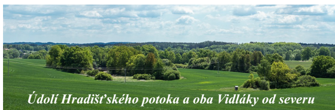
Údolí Hradištského potoka a oba Vidláky od severu

Mamě pátráme po Hradištském potoku. Je schován v potrubí, aby v nejnižším místě cesty nakrátko vykoukl, vzápětí se opět schoval, a pod zemí pokračoval do severního chobotu Dolního Vidláku.