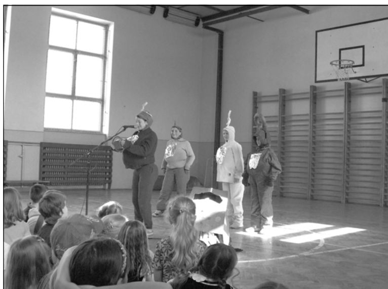
Žáci páté třídy jako Teletabís, jenž známe z TV obrazovek