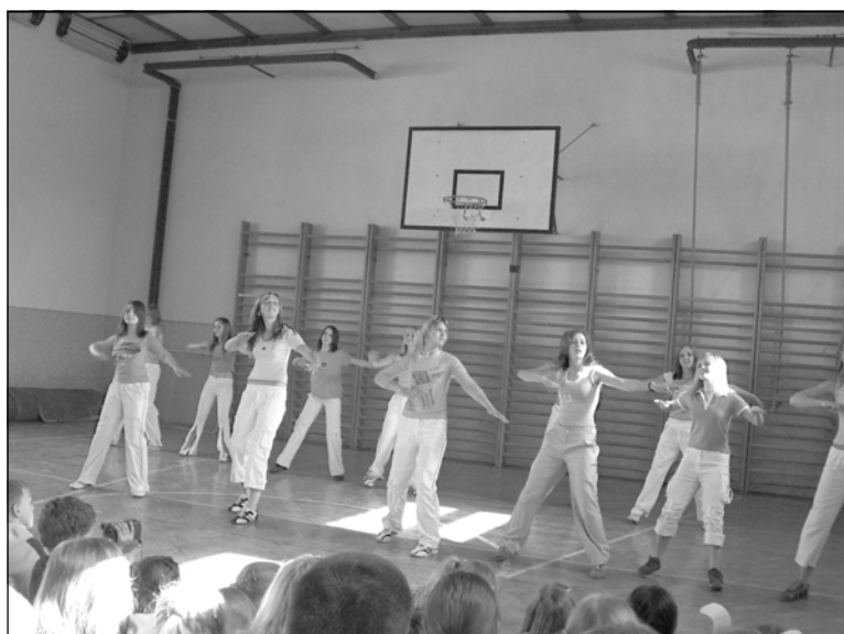
Vystoupení dívek z 9. třídy bylo jedním ze závěrečných bodů akademie.