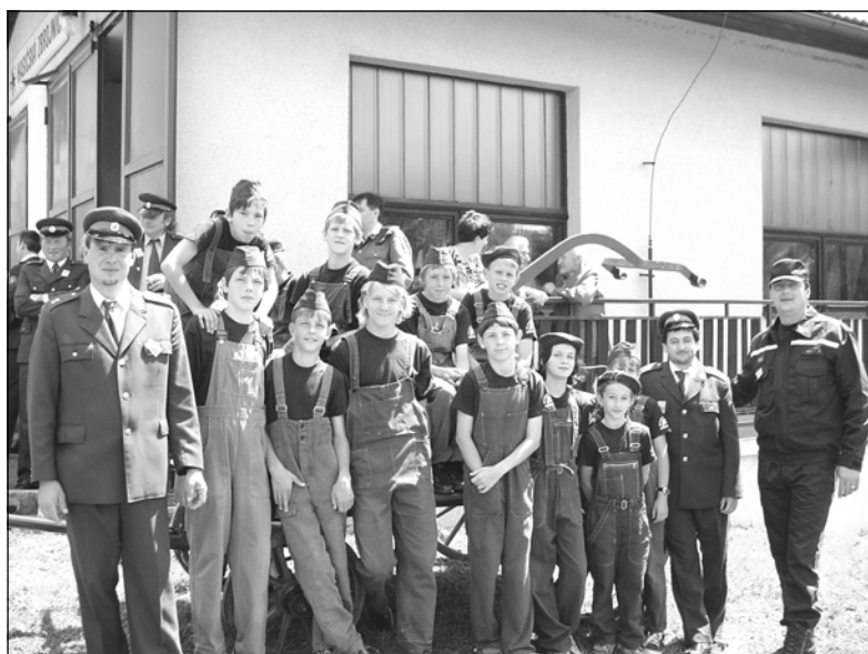
Družstvo mladých hasičů z Oselec