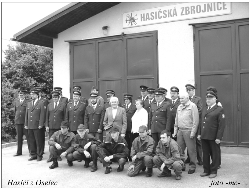
Hasiči z Oselec

Po rozlosování pořadí družstev následovala štafeta, kde byla nejlepší Polánka s časem 81,5 s.