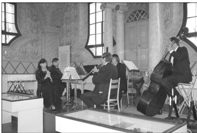
Vystoupení souboru Ars Instrumentalis Pragensis

Umělecký zážitek diváků byl pak jistě dovršen posezením s účinkujícími a organizátory Hudby v synagogách plzeňského regionu přímo v prostorách synagogy spolu s malým občerstvením. -rkn-