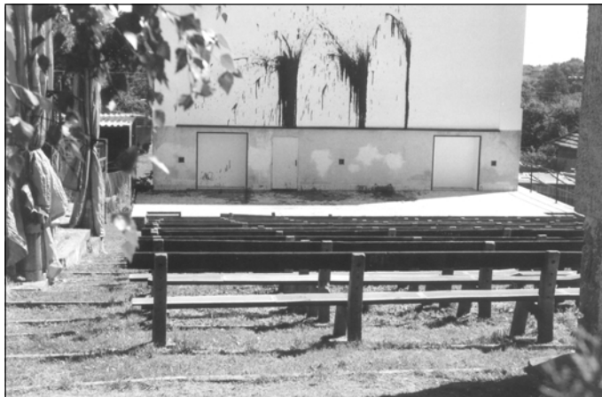
Poničená promítací plocha letního kina v Kasejovicích

Poslední týden v srpnu poničili neznámí vandalové promítací plochu letního kina v Kasejovicích a přičinili se tak k předčasnému ukončení promítací sezóny v letošním roce.