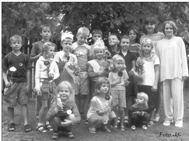
Část dětí, které se zúčastnily prvního ročníku Miss a Missák Řesanice

V sobotu 10. září 2005 se v Řesanicích konala historicky první soutěž Miss a Missák Řesanice. Zúčastnilo se 18 soutěžících. Kluci a holky soutěžili v různých disciplínách, např. promenáda v pyžamech a v oblečení opačného pohlaví. Nesměla také chybět volná disciplína.