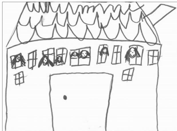
Obrázek nové školy nakreslila Adélka Červená z I. třídy