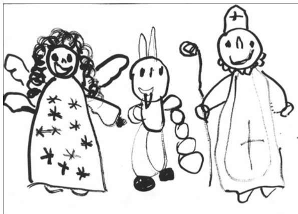
Mikulášskou nadílku nakreslila Lucinka Kurcová