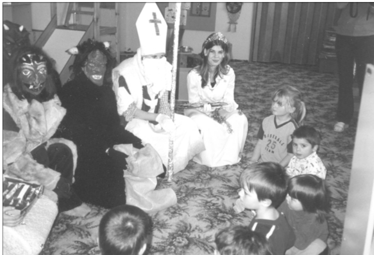
Mikulášská nadílka v Mateřské škole v Kasejovicích

Měsíc prosinec byl velmi pestrý. Vše začalo činnostmi přímo čertovskými. Děti stavěly peklo, vyráběly masky, hrály čertovské hry, kreslily čerty, učily se básničky a písničky pro Mikuláše. Přišli nejen čertovsky vypadající čerti, ale i Mikuláš a Anděl. A protože v tu chvíli byly ve školce všechny děti hodné, čerti žádné neodnesli ba naopak, všechny byly obdarované čertovským perníkem a mikulášskými dobrotami.