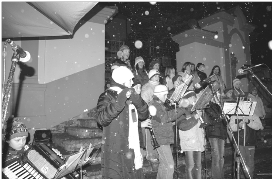
Vystoupení souboru Notička ze ZUŠ Nepomuk pobočky Kasejovice

Na sklonku roku 2005 se obec Kasejovice poprvé zapojila do Vánočního zpívání koled spolu s dalšími šesti městy Plzeňského kraje s Plzní, Přeštice-mi, Nepomukem, Sušicí, Chlumčany, Spáleným Poříčím.