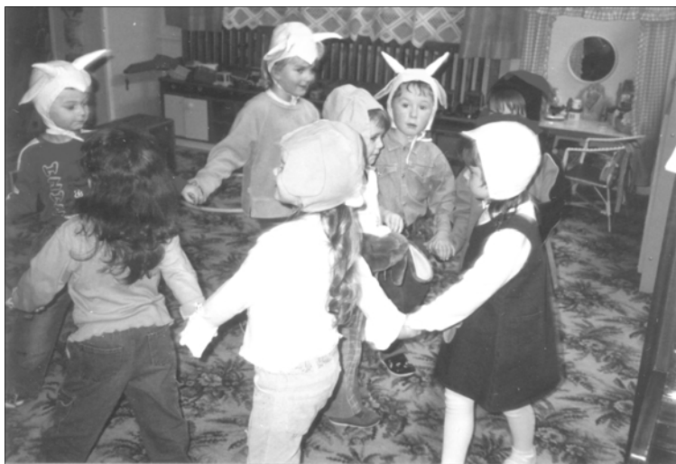
Vystoupení dětí ze třídy Zajíčků při vánoční besídce

Odpoledne přišli i rodiče, které děti potěšily vánočním vystoupením a vlastnoručně vyrobeným dárečkem.