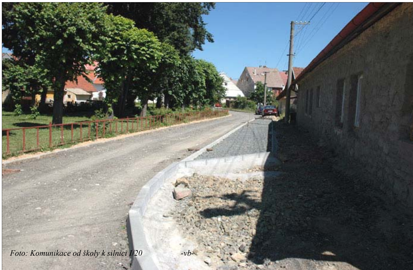
Foto: Komunikace od školy k silnici I/20