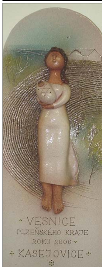
Keramika - Vesnice Plzeňského kraje roku 2006 Kasejovice

Měsíčník obcí Hradiště, Kasejovice, Mladý Smolivec, Nezdřev, Oselce a Životice