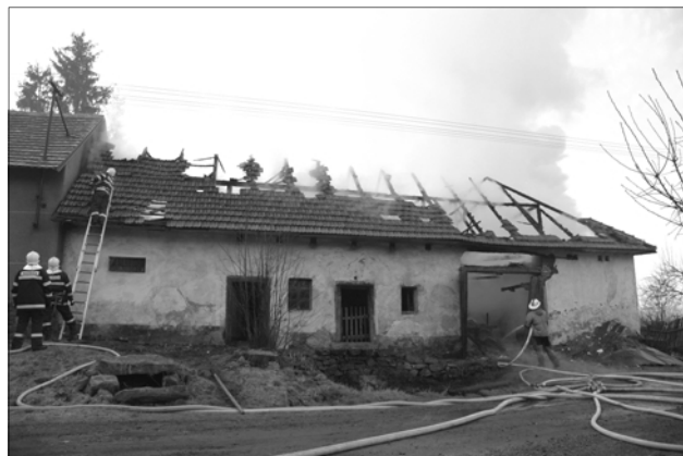
Na snímku zásah hasičů při požáru v Dožicích