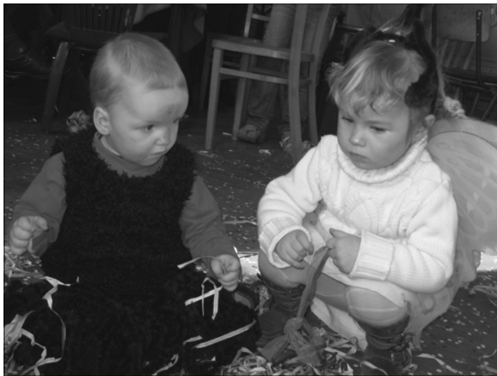
Na snímku děti na bále v Hradišti