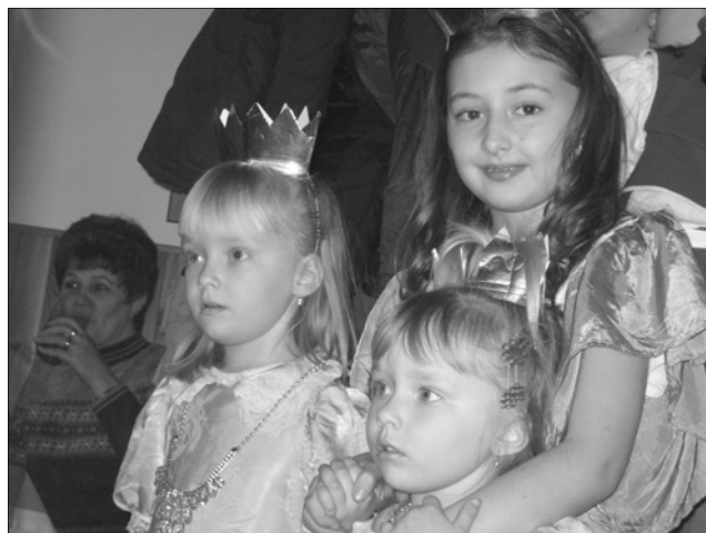
Na snímku děti na bále v Bezděkově