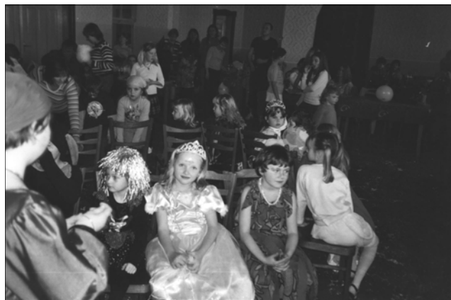
Na snímku soutěž dětí na bále v Kasejovicích