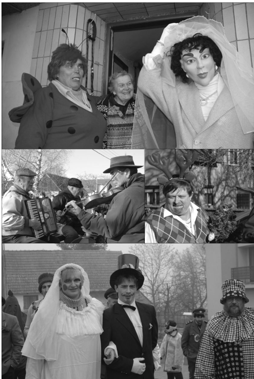
Na snímcích shora masopustní průvod v Radošicích, ve Starém Smolivci a na poslední fotografii v Oselcích.