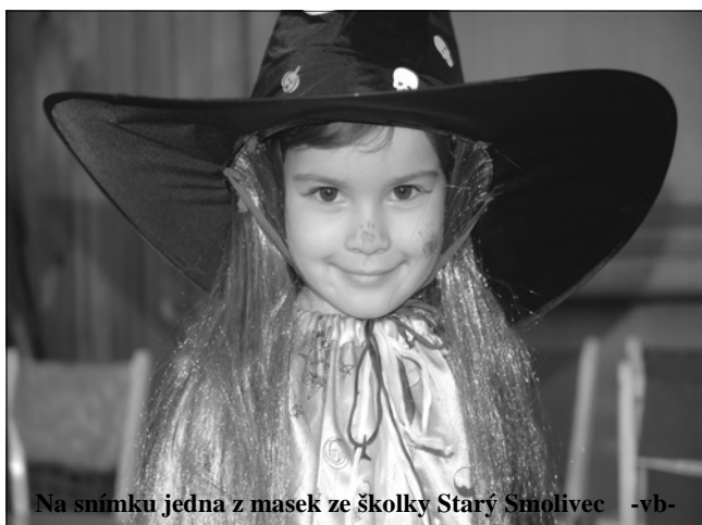
Na snímku jedna z masek ze školky Starý Smolivec -vb-