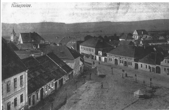
Kasejovické náměstí po roce 1912

Roku 1919 byly kolem náměstí postupně zřízeny chodníky, které po pravé straně silnice směrem k Blatné byly položeny až k radnici. Náklady na jejich výstavbu nesla z poloviny obec, druhou polovinu hradili občané, před jejichž domem byl chodník zbudován. Ještě krátce