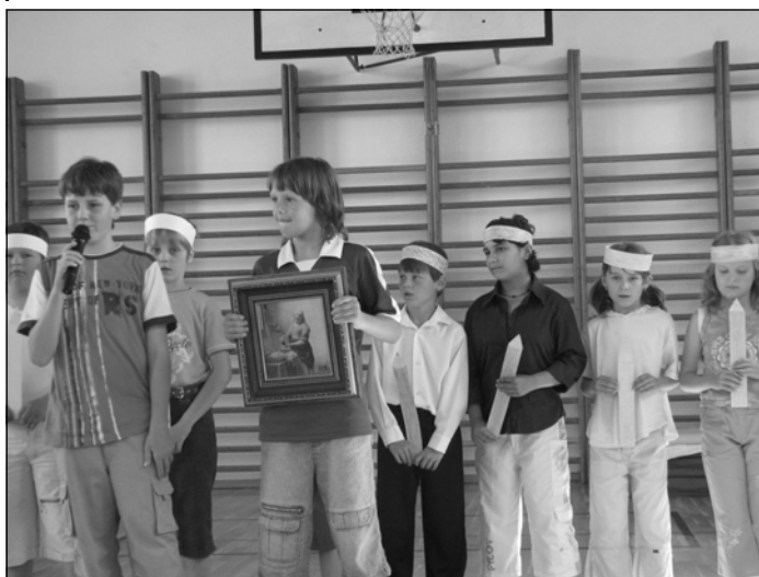
Vystoupení žáků III. třídy na školní akademii foto -jv-

Jiří VONDRUŠKA, učitel Základní školy Kasejovice