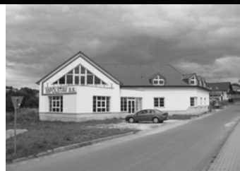
1. RADOMYŠL OKR. ST