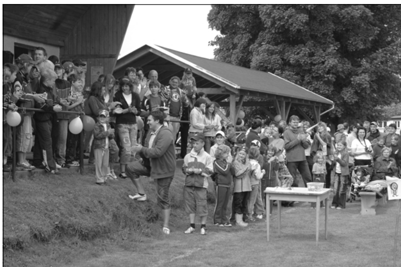
Ohlas diváků na vystoupení Kynologického klubu Blovice