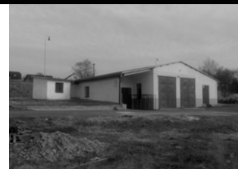
2. KASEJOVICE OKR. PJ