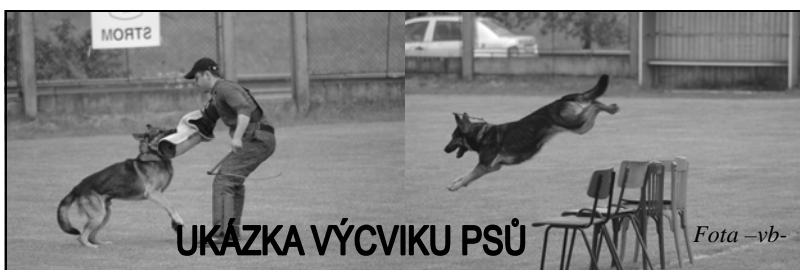
UKÁZKA VÝCVIKU PSŮ