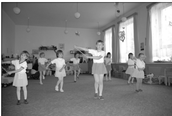
Vystoupení dětí z Mateřské školy Starý Smolivec na besídce pro maminky

Dne 16. 5. byla ve školce besídka pro maminky. Po krátkém uvítání vystoupily malé mažoretky,