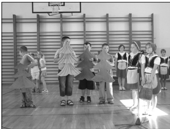
Vystoupení žáků II. třídy na školní akademii