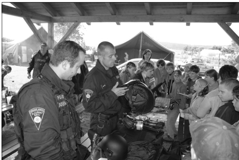
Ukázka techniky Policie ČR

První červnová sobota se na kasejovickém fotbalovém hřišti odehrávala ve znamení oslav Dne dětí. Ačkoliv jejich svátek připadá v kalendáři na 1.června, společně slavit mohli přijít jak malí tak velcí i o den později. Tělovýchovná jednota Sokol Kasejovice pro ně ve spolupráci s Městským úřadem Kasejovice připravila den plný her, zábavy a sou-