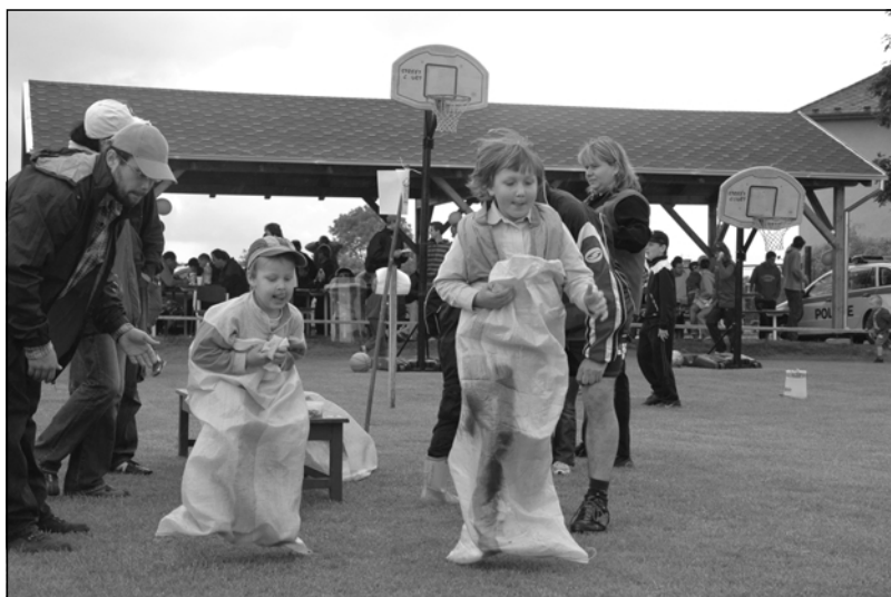
Soutěž ve skákání v pytlích