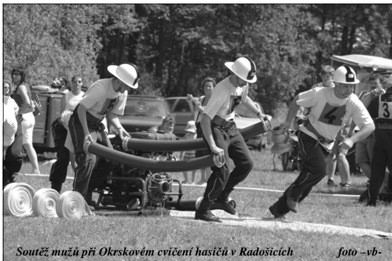
Soutěž mužů při Okrskovém cvičení hasičů v Radošicích