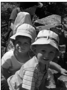
Výlet do ZOO Plzeň