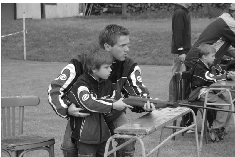
Soutěž ve střelbě ze vzduchovky