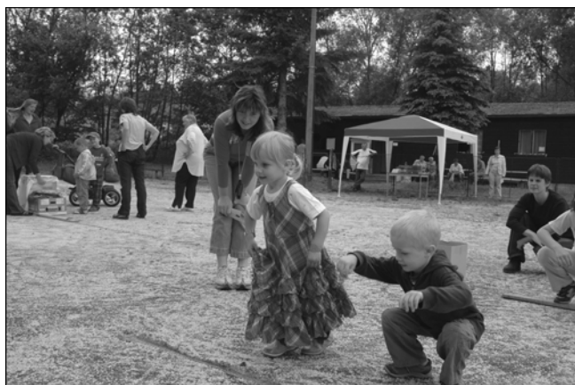
Soutěžící děti v Hradišti na Dětském dni

Pořadatelé děkují manželům Brejchovým, Štolbovým a Merhoutovým a všem, kteří se podíleli na přípravách. -vb-