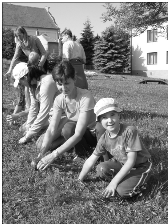
Sázení stromků při oslavě Dne dětí v Mateřské škole Kasejovice