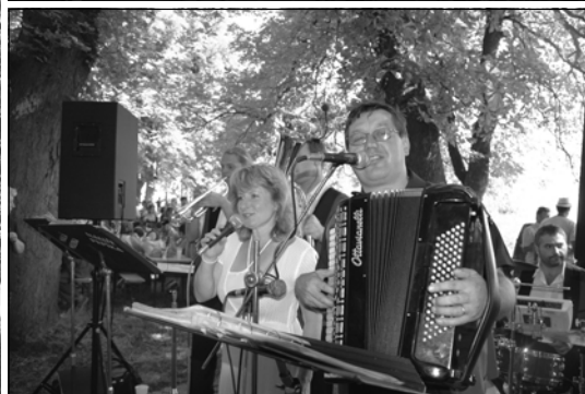
Na snímcích zleva návštěvníci oselecké poutě před kaplí sv. Markéty, shora výstava historických motocyklů, dole vystoupení Malé muziky ze Sušice.