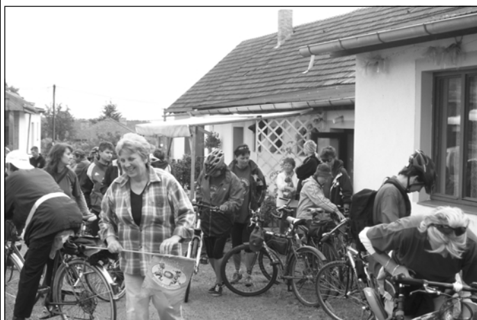
Účastníci Tour de Oblouk před Nezdřevskou hospodou těsně před startem

Sbor dobrovolných hasičů Budislavice Vás zve na