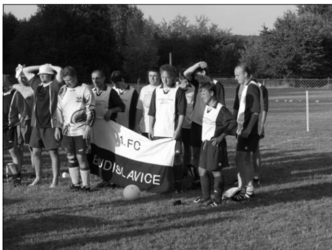
Tým 1. FC Budislavice