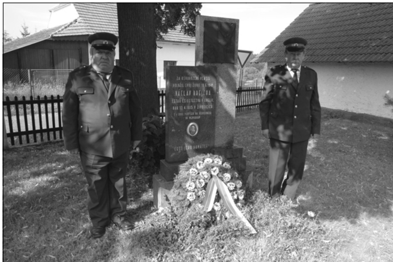
Členové Sboru dobrovolných hasičů Životice při položení věnce u pomníku k památce Václava Brejchy