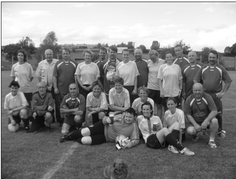
Na snímku Stará Garda TJ Sokol Kasejovice a ženy Litěň 33

Samozřejmě ty nejmenší lákaly během víkendu nejvíce pouťové atrakce umístěné tradičně na Hulačovic louce, a tak si na pouťi v Kasejovicích našel každý to svoje od sportu, kultury až po zábavu. -mr-