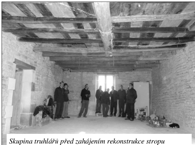
Skupina truhlářů před zahájením rekonstrukce stropu