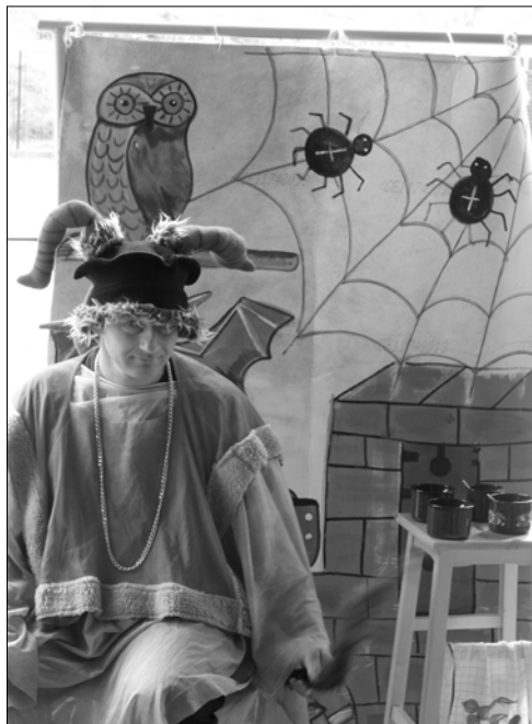
Na snímku ukázka z pohádky v podání souboru Čekanka

Je mi opravdu líto, že rodiče nepřivedli své