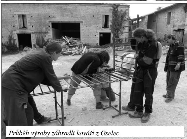
Průběh výroby zábradlí kováři z Oselec