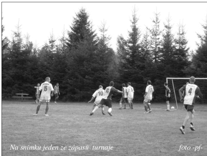
Na snímku jeden ze zápasů turnaje