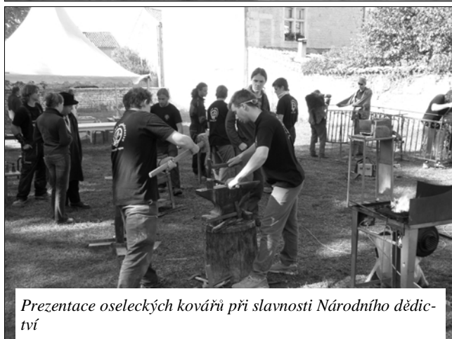
Prezentace oseleckých kovářů při slavnosti Národního dědictví