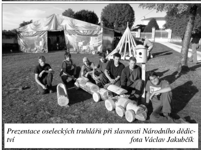
Prezentace oseleckých truhlářů při slavnosti Národního dědictví