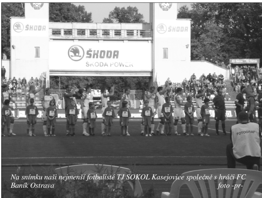
Na snímku naši nejmenší fotbalisté TJ SOKOL Kasejovice společně s hráči FC Baník Ostrava