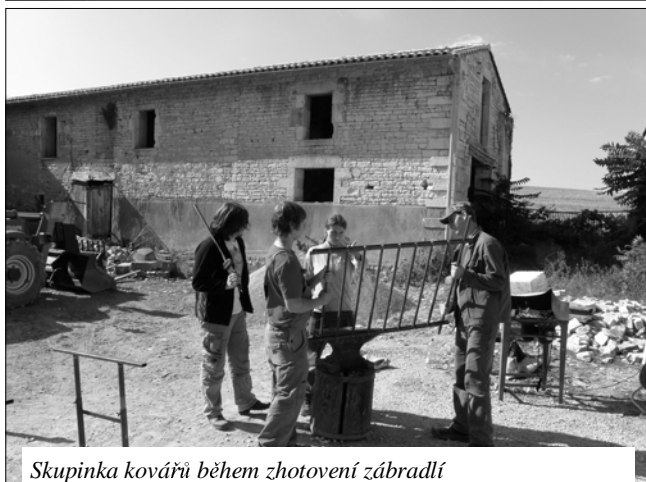
Skupinka kovářů během zhotovení zábradlí