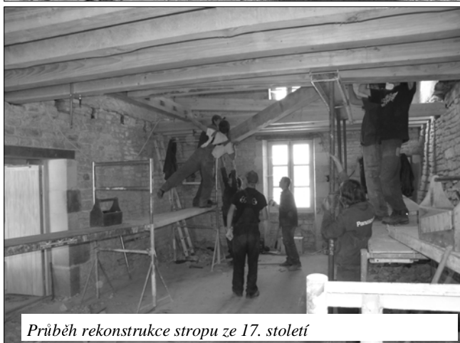
Průběh rekonstrukce stropu ze 17. století