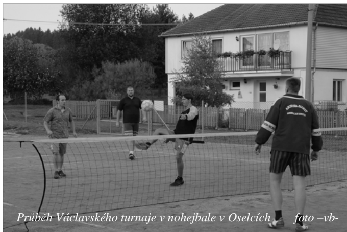
Průběh Václavského turnaje v nohejbale v Oselcích