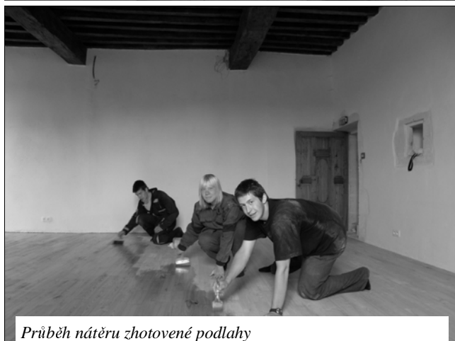
Průběh nátěru zhotovené podlahy