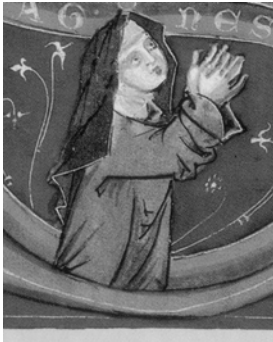
Svatá Anežka česká

Svatá Anežka Česká (1211 – 1282) patří mezi nejvýznamnější české zemské patrony. Narodila se jako dcera českého krále Přemysla Otakara I. a jeho manželky Konstancie kolem roku 1211 v Praze. Již jako dítě byla poslána do kláštera cisterciáček v slezské Třebnici. Další duchovní zkušenosti získávala v doksanském klášteře premonstrátek. Svátá Anežka se od svého mládí nepohybovala pouze v klášterním prostředí. Politika jejího otce Přemysla jí umožnila seznámit se životem na jiném královském dvoře než českém, neboť již v dětství byla zasnoubena se synem německého císaře Fridricha II. Jindřichem. Z tohoto, ale i dalších politických sňatků Anežky se syny evropských králů, sešlo a Anežka se tak mohla plně věnovat své vysněné duchovní kariéře. Od svého bratra Václava I. získala pozemky u řeky Vltavy, kde z prostředků svého královského věna nechala roku 1231 vybudovat klášter se špitálem. Při tomto klášteře (dnešní Anežský klášter) založila špitální bratrstvo, které bylo později povýšeno na řeholní řád křížovníků s červenou hvězdou, jediný mužský církevní řád, jenž se zrodil v českém prostředí.