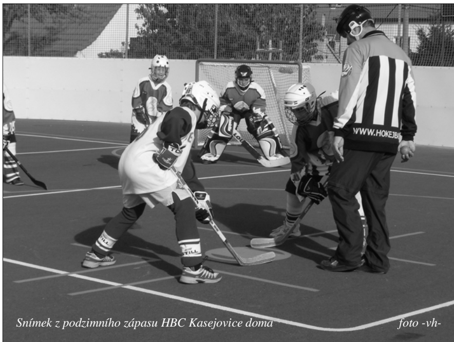
Snímek z podzimního zápasu HBC Kasejovice doma