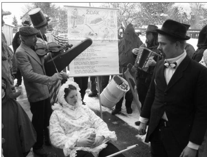
Masopustní průvod v Oselcích