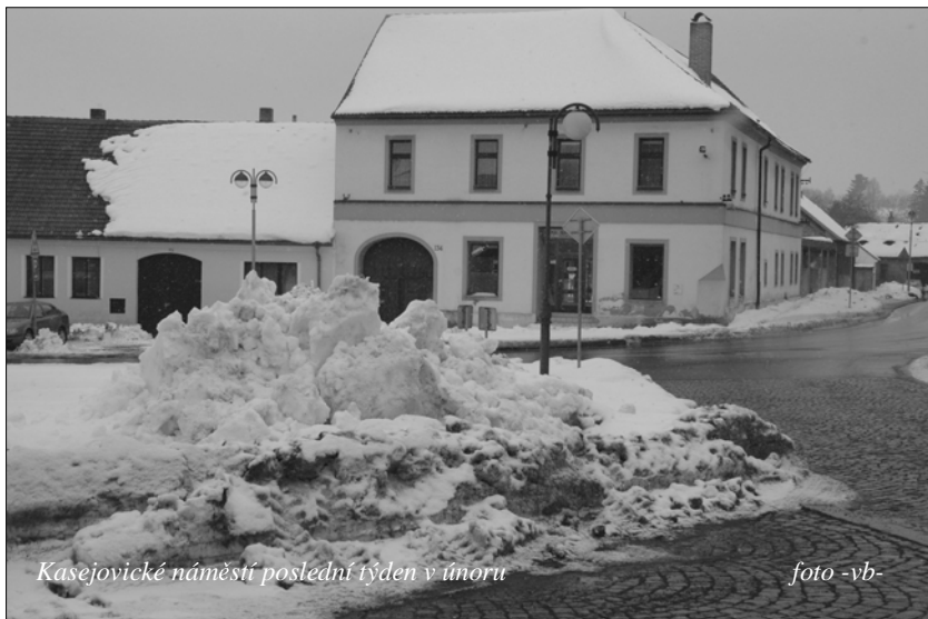
Kasejovické náměstí poslední týden v únoru