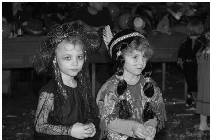
Maškarní bál pro děti v Kasejovicích