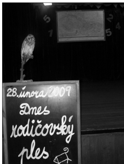
Uvítání na sále restaurace „U Adamců“ v sobotu 28.2. 2009

Na poslední únorovou sobotu připravilo Sdružení rodičů a přátel školy ve spolupráci se Základní školou Kasejovice tradiční rodičovský ples. Na sál restaurace „U Adamců“ zavítalo za tancem a zábavou kolem stosedmdesáti rodičů a přátel školy, aby si užili pravděpodobně první a poslední bál tohoto roku v Kasejovicích. Oproti minulému roku, kdy se tento ples uskutečnil po dlouhote odmlce opět v Kasejovicích, pořadatelé očividně zapracovali na pestrosti tomboly, výzdobě sálu a programu celého plesu.