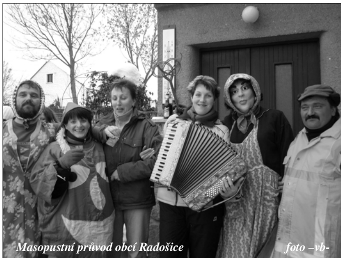
Masopustní průvod obcí Radošice