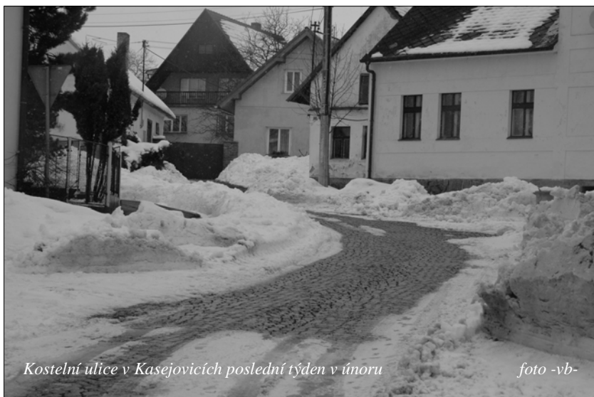
Kostelní ulice v Kasejovicích poslední týden v únoru