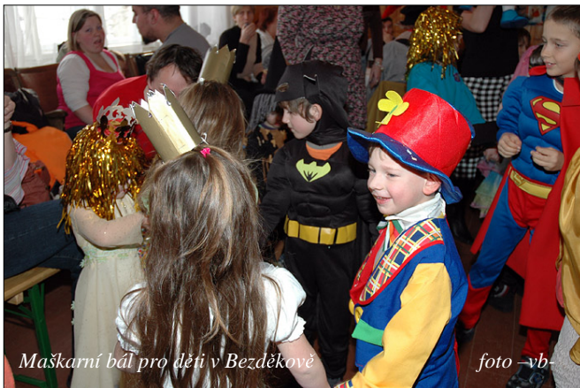
Maškarní bál pro děti v Bezděkově

Letošní rok byl výjimečný vystoupením Ochotnického divadla Mačkov, které zahrálo hned na začátku bálu dvě pohádky. Poté následovala volná zábava se soutěžemi, tan-