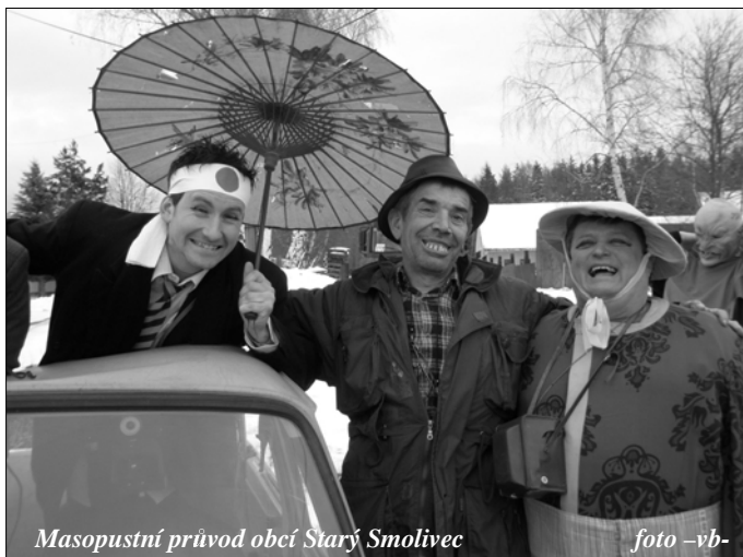
Masopustní průvod obcí Starý Smolivec