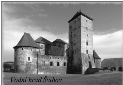
Vodní hrad Švihov

Nejprve jsme si prohlédli vodní hrad Švihov. Dozvěděli jsme se, že zaujímá důležité místo mezi našimi opevněnými stavbami a obdivovali jsme zde jeden z nejlépe dochovaných