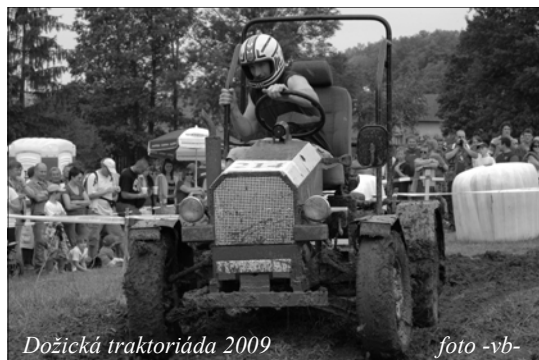
Dožická traktoriáda 2009