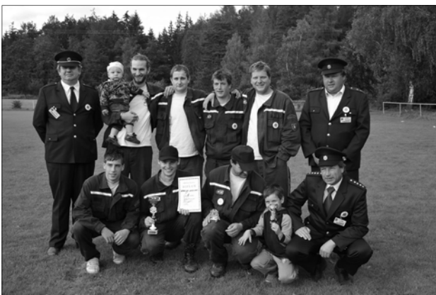
Družstvo SDH Starý Smolivec

O první příčku se podělila obě dětská družstva jak z Mladého Smolivce tak z Radošic. Za ženy se zú-