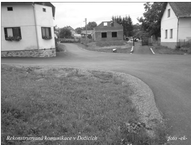
Rekonstruovaná komunikace v Dožicích

Dokončení druhé etapy a tím i celého projektu se plánuje na konec července a začátek srpna roku 2009. Celý projekt je dotován z 3. výzvy Regionálního operačního programu NUTS II Jihozápad, prioritní osa Dostupnost center, oblast podpory Rozvoj místních komunikací. Celkové náklady projektu mohou být až 6.177.724,54 Kč (jelikož jsme vysoutěžili ve výběrovém řízení méně, této částky nedosáhneme), po splnění všech