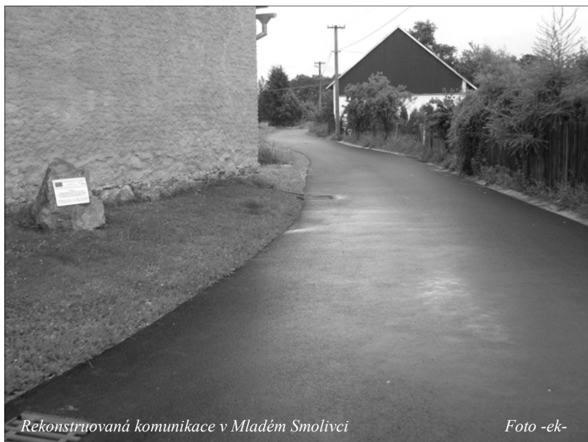
Rekonstruovaná komunikace v Mladém Smolivci