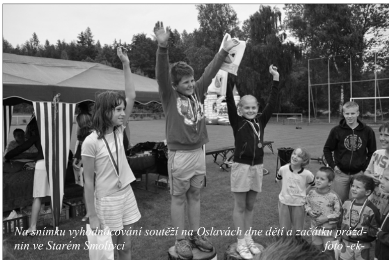
Na snímku vyhodnocování soutěží na Oslavách dne dětí a začátku prázdnin ve Starém Smolivci