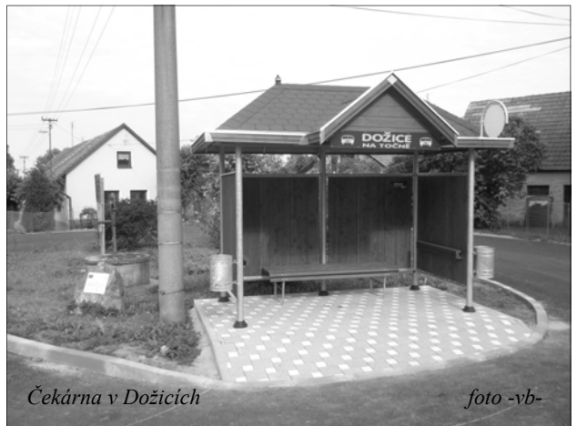
Čekárna v Dožicích

V Dožicích a ve Starém Smolivci se občané dočkali nových čekáren na autobusových zastávkách. Staré nevhodné plechové čekárny, jednu ve Starém Smolivci a dvě v Dožicích, jsme nahradili novými, dřevěnými. Všechny tři čekárny byly v žalostném stavu, čekárna v Dožicích u pošty slouží v současné době dokonce jako čekárna na pojízdnou prodejnu, neboť od ledna zde máme zavřený obchod.