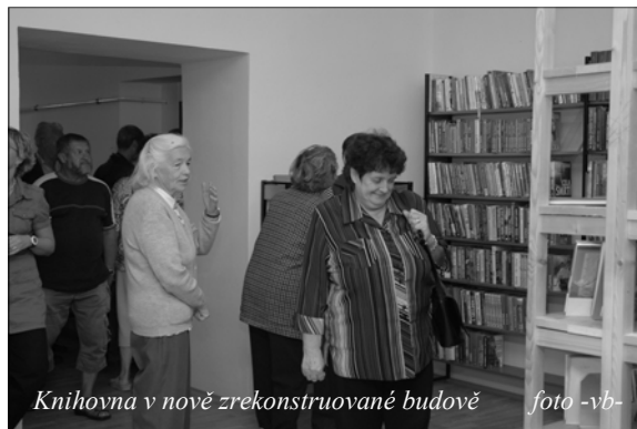
Knihovna v nově zrekonstruované budově