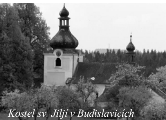
Kostel sv. Jiljí v Budislavicích

Mše svaté budou slouženy ve farním kostele sv. Jakuba staršího v Kasejovicích každou neděli od 9.30 h a ve všední dny v úterý až pátek od 18.00 (v zimní době od 17.00 h).