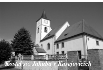
Kostel sv. Jakuba v Kasejovicích

Římskokatolická farnost Kasejovice: Kasejovice, Hradiště, Chloumek, Polánka, Předmíř, Újezd u Kasejovic a Zámlyní.