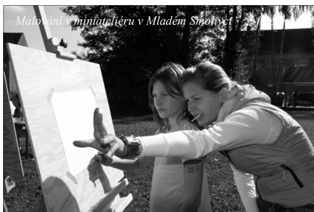
Malování v miniateliéru v Mladém Smolivci

malovalo na tabuli a lezlo na stěnu přímo horolezeckou. Ovšem nejvíce děti zaujal malířský