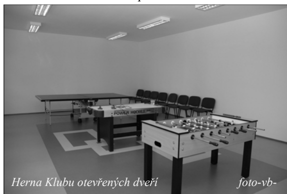
Herna Klubu otevřených dveří