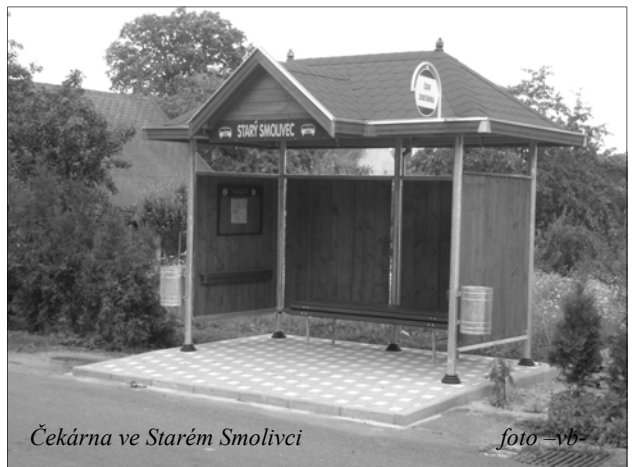
Čekárna ve Starém Smolivci

V Dožicích je to autobusová zastávka Na točně a U pošty, ve Starém Smolivci u Panušků. Všem třem čekárnám na zmíněných zastávkách odzvonilo již vloni, kdy jsme se zastupiteli rozhodli, že je vyměníme. Začátkem letošního roku jsme podali žádost na Krajský úřad Plzeňského kraje do Programu stabilizace a obnovy venkova na projekt s názvem „Veřejná prostranství v okolí autobusových zastávek včetně výměny čekáren“, a když nám ji na kraji schválili, bylo definitivně rozhodnuto.