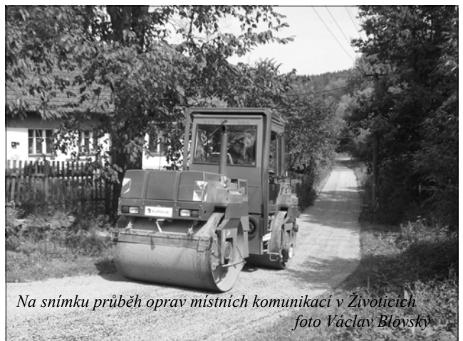
Na snímku průběh oprav místních komunikací v Životicích

V průběhu srpna se obyvatelé Životic dočkali nových povrchů místních komunikací. "Jsme velmi rádi, že se nám po několika letech podařilo zajistit dostatek prostředků na opravu. Cesty v obci byly ve velmi špatném stavu", konstatuje Karel Hlinka starosta obce. Obecní úřad Životice ze svého rozpočtu uvolnil 180 000 korun a 210 000 korun poskytl formou dotace Krajský úřad Plzeňského kraje z Programu obnovy venkova. Celkem se opravilo 2800 m 2 povrchů cest v celkové hodnotě 390 000 korun. -vb-