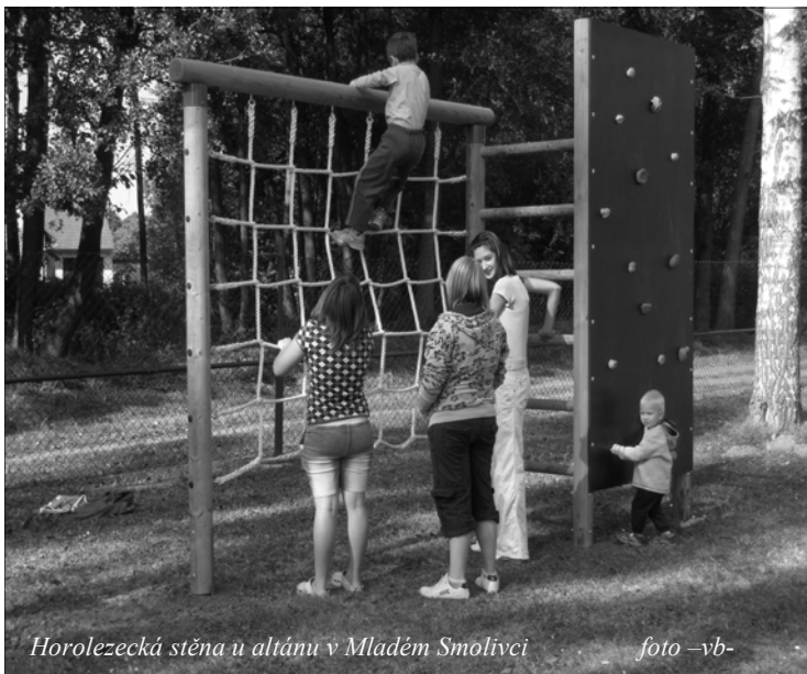
Horolezecká stěna u altánu v Mladém Smolivci

Altán o zastavěné ploše skoro 50 m 2 a cca 70 míst k sezení bude sloužit dětem a rodičům nejen Mladého Smolivce. Původní nápad postavit přístřešek na pořádání tanečních zábav vzal brzy za své. Rozhodli jsme se pro širší využití altánu. Společně s dětmi jsme vytvořili návrh, jak takový multifunkční altán bude vypadat ještě před vánocemi roku 2008. Zpracovali jsme projekt s názvem