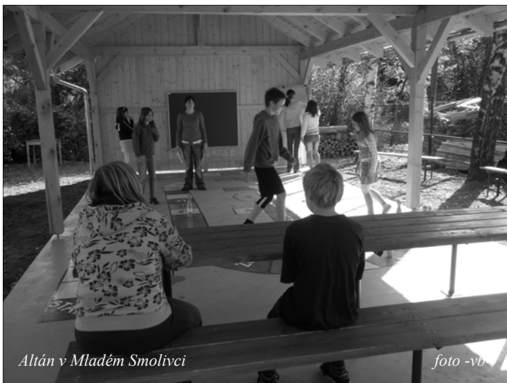
Altán v Mladém Smolivci

Poslední zářijový víkend letošního roku jsme vyrazili všichni na hřiště do Mladého Smolivce za budovu obecního úřadu. Důvodem, proč jsme se tam sešli, bylo otevření nového altánu s příslušenstvím.