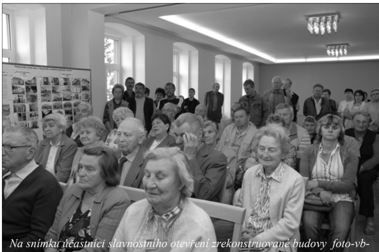
Na snímku účastníci slavnostního otevření zrekonstruované budovy

V pátek 25. září se široké veřejnosti otevřely dveře nově zrekonstruované budovy staré školy na kasejovickém náměstí. Ta se během uplynulých 10 měsíců proměnila v moderní společensko-kulturní centrum. V budově staré školy našly svůj prostor společenská místnost, klub otevřených dveří, klub seniorů Babí léto a mateřské centrum Sedmíkráska. Nový prostor zde získala rovněž místní knihovna.