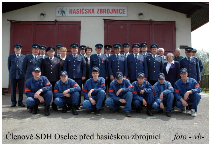
Členové SDH Oseltice před hasičskou zbrojnicí