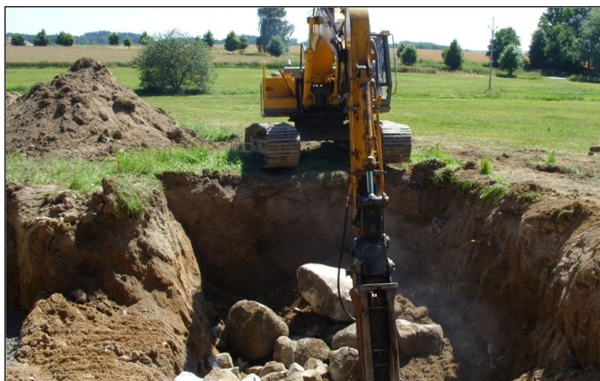
Bourání skalního podloží v místě budoucí čistírny odpadních vod