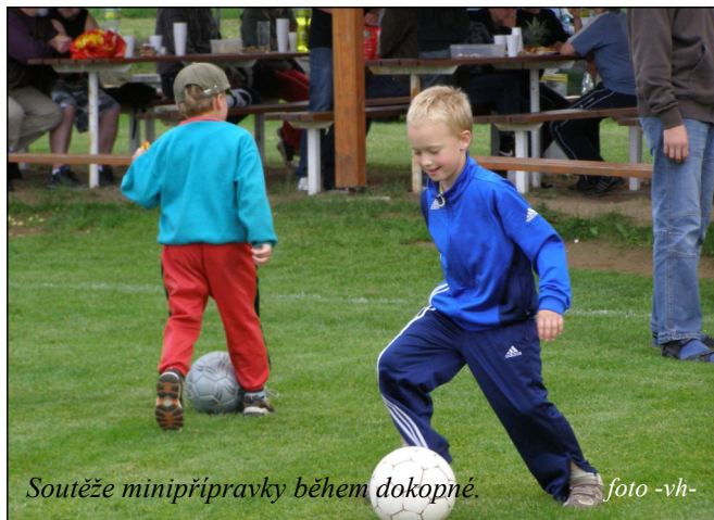
Soutěž minipřípravy během dokopné.