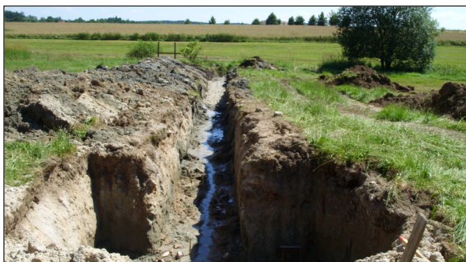
Výkop pro pokládku potrubí