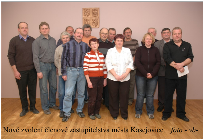
Nově zvolení členové zastupitelstva města Kasejovice.