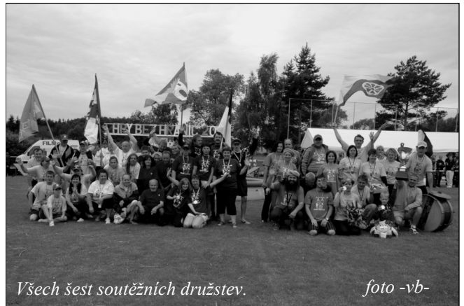
Všech šest soutěžních družstev.