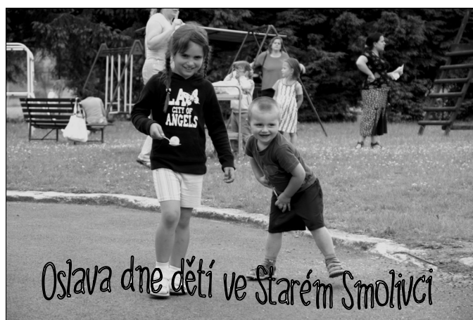
Oslava dne dětí ve Starém Smolivci