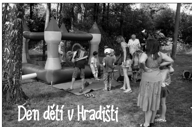
Den dětí v Hradišti

Knihovna umožňuje přístup veřejnosti na internet zdarma.