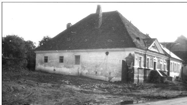
Dům č.30, hostinec U Sladkých zvaný také Na schůdkách a část proluky vzniklé demolicí domu č.29.