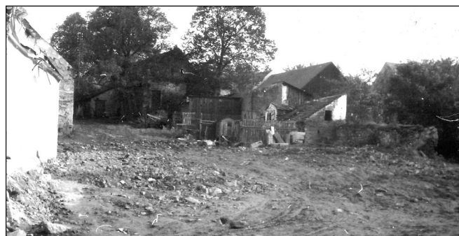
Pohled do dvora domu č.29 po demolici v r. 1974. Zbytky zdi (tmavé nízké) zcela vpravo je místo bývalé lednice, kde údajně býval vchod do podzemní chodby.

navštěvovat hostince Na Růžku, U Ježků a zejména Hotel Adamec. Místní fotbalové mužstvo našlo své útočiště v hostinci U Sladkých, zvaném také Na schůdkách a jeho skalní příznivci je následovali. Světová hospodářská krize v 30. letech minulého století způsobila nedostatek peněz mezi obyvatelstvem, dosud hojně navštěvované výroční trhy přišly o prodejce i kupce a tím klesaly i tržby v místních hostincích.