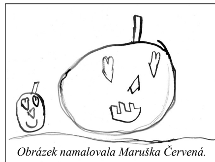
Obrázek namalovala Maruška Červená.