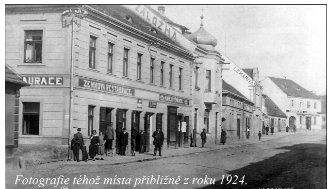
Fotografie téhož místa přibližně z roku 1924.

Zdálo by se, že plesy byly pořádány jako zdroje pouhého veselí. Měly patrně i jiné, nikde neuváděné poslání - alespoň já jsem o tom hluboce přesvědčen. Na plesech se setkávali i lidé, kteří se často velmi dlouho neviděli - bývali spolužáci, osoby, které se už dříve někde odstěhovaly, ale do Kasejovic k příbuzným přece jen občas přijeli atd. Při pěkném popovídání, vzpomínkách na mladá léta, při pivečku, zpěvu a tanci se stará přátelství utužovala a nová vznikala a někdy (i když ne příliš často) se zde podařilo zdárně a smírnou cestou vyřešit i dlouhotrvající drobné sousedské spory. A možná, že bychom se nedopočetili, kolik šťastných manželství vděčilo za svůj vznik tomu, že dva mladí lidé se právě zde poprvé setkali při tanci a našli v sobě zalíbení. Odborník psycholog by řekl, že na plesech se lidé snažili odreagovat od každodenních problémů. My s ním sice budeme souhlasit méně odborně: „Když jsme na ples nebo jinou taneční zábavu šli, hodili jsme své starosti za hlavu už před svým odchodem z domova!“... ale to bývávalo, když jsme ještě byli o mnoho mladší... -káf-