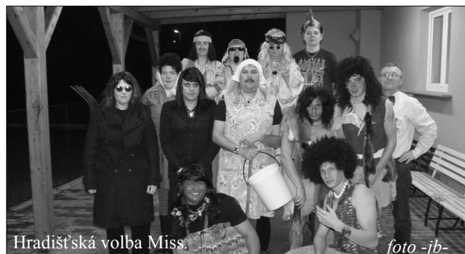
Hradištská volba Miss.