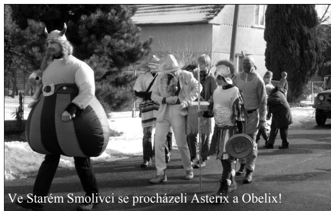
Ve Starém Smolivci se procházeli Asterix a Obelix!