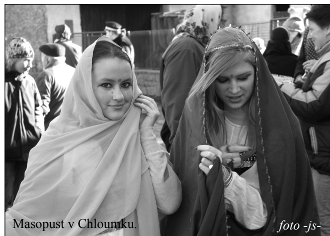
Masopust v Chloundku.

Fotografie z této a předchozích událostí si můžete prohlédnout na nových webových stránkách naší obce: www.chloundecko.cz J.S. ml.