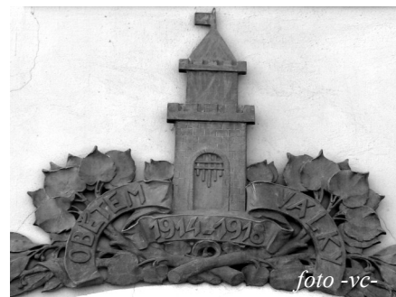
Plastika inspirovaná zkomoleným znakem města na průčelí radnice.