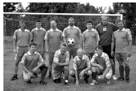
Vítězné mužstvo Sokola Vrbno