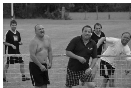
Při nohejbalovém turnaji vládla pohoda