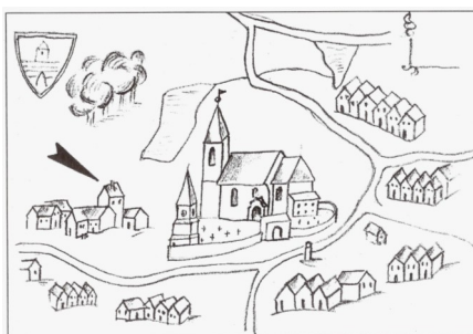
Kresebná kopie pohledu na Kasejovice z roku 1698 - předpokládaná budova tvrze označena šipkou.