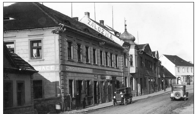
Fotografie z let 1922 - 1923, kdy bylo v Kasejovicích budováno veřejné osvětlení.