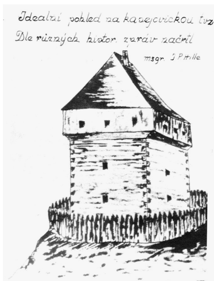
Představa J.P. Hilleho o kasejovické tvrzi.

postupně zarovnávana. Bohužel nebyl učiněn žádný průzkum a co je nejhorší, ani zakresleno rozložení pozůstatků zdíva, což by pomohlo určit půdorys tvrze a stanovit alespoň přibližně její polohu. A tak zůstala jen kresba P. Jana Pavla Hilleho, který si kasejovickou tvrz představoval jako věžovitou stavbu o třech patrech, posledním roubeným, která byla kryta dlátkovou střechou a obehnaná dřevěnou palisádou. Zemní opevnění pak představoval dodnes dochovaný val. I když k tomu