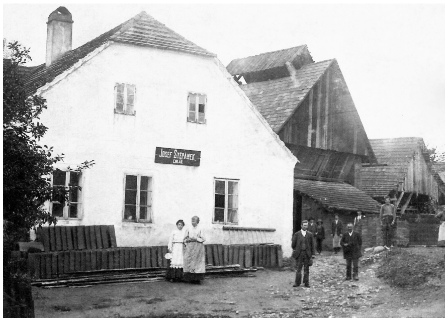
Cihelna Josefa Štěpánka U Nových hrobů ukončila svou činnost po 1. sv. válce

T řetím stoletým jubilem bylo loňského roku mohla být i obecni cihelna u lesa Berandubu, pokud by se ovšem dochovala až do dnešních dnů; její historie je však natolik zajímavá, že si také o jejích osudech něco povíme: