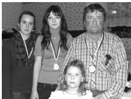
Vítězové letošního turnaje.