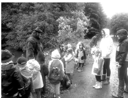
Ukázka práce se psy