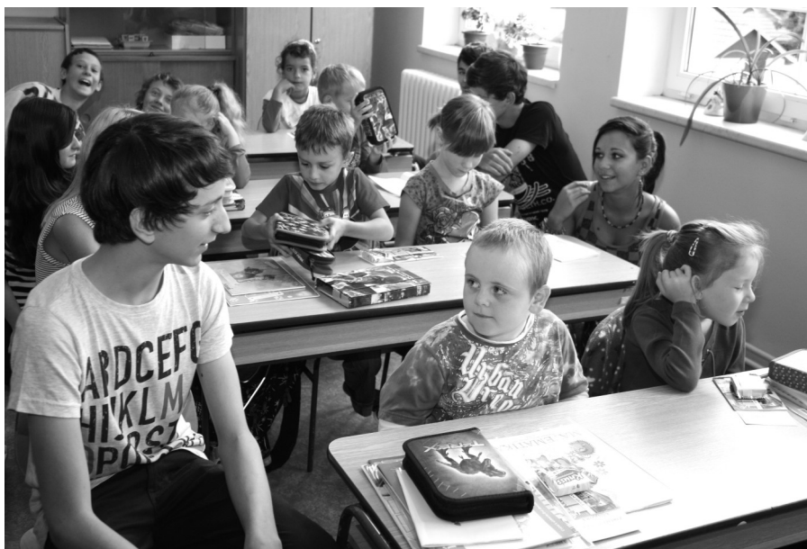
Prvnáčci se svými patrony - žáky 8. třídy.

Měsíčník města Kasejovice a obcí Hradiště, Mladý Smolivec, Nezdřev, Oselce a Životice