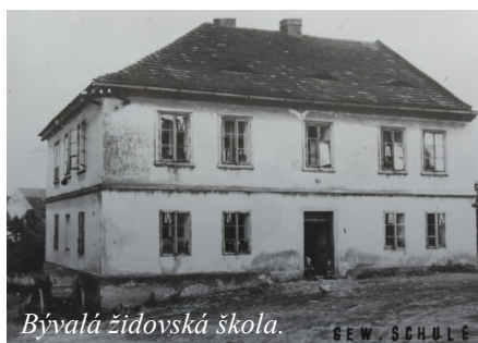
Bývalá židovská škola.

J ak jistě kasejovická veřejnost ví, v současné době se upravuje podzemí synagogy za účelem dalšího možného rozšíření muzejních prostor. Možná, že problémy s těmito prostory, vlhkost, nedostatečné osvětlení a nemožnost vytápění způsobí, že běžné exponáty zde nebude možné vystavovat. Uvažuje se s možností vystavované artefakty vystavovat pouze v příznivých měsících.