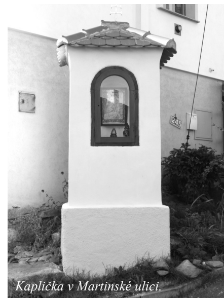
Kaplička v Martinské ulici.