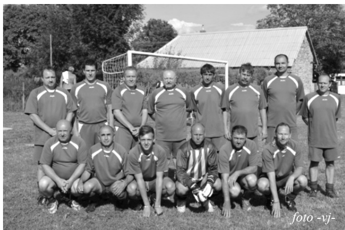
Vítězné kasejovické mužstvo