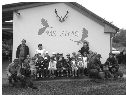
Školka Starý Smolivec