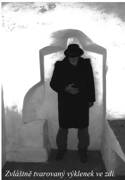
Zvláště tvarovaný výklenek ve zdi.

V černé kuchyni jsou samozřejmě výklenky pro uložení kuchyňského nádobí na policích. Zajímavý je však tvar jednoho výklenku, který zaujme vnímavého návštěvníka. Má tvar podivuhodné bytosti podobné lidské postavě s výškou cca 2 metry a velice širokými rameny.