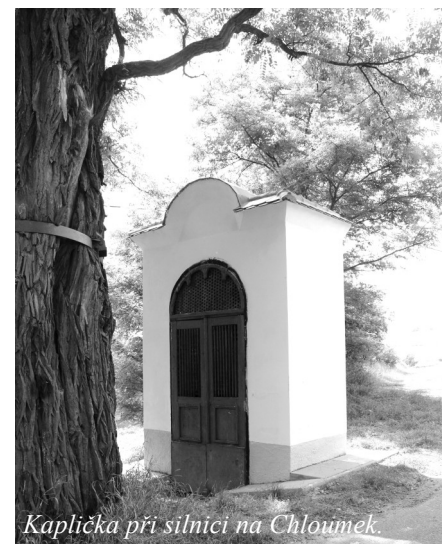
Kaplička při silnici na Chloumek.