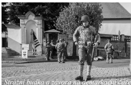
Strážní budka a zápora na demarkační čáře.