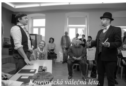
Kasejovická válečná léta.

V průběhu vystoupení byli návštěvníci seznámeni formou komentáře, čtení z obecní kroniky, a vtipných i vážných scének s dalšími událostmi válečných let. (dokončení na str. 7)