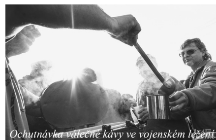
Ochutnávka válečné kávy ve vojenském ležení.