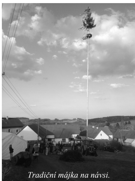
Tradiční májka na návsi.

nový. Jedná se opět o lípu a to o lípu srdčitou, která byla přivezena ze Zahradnictví Vrčeň Arbocom s.r.o. Strom je vysoký 280 cm. Zasazen byl opět vedle sochy sv. Jana Nepomuckého při výjezdu z obce Oselce na obec Chlumy po levé straně. -vh-