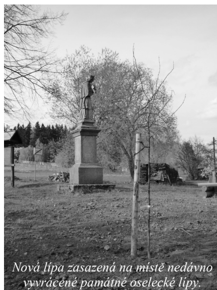
Nová lípa zasazená na místě nedávno vyvrácené památné oselecké lípy.