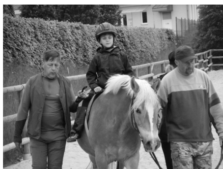
Jako každý rok, tak i letos jezdily děti z MŠ Starý Smolivec s kasejovickou školkou do Mačkova na plavání. Děti se také mohly svěřt na koni.