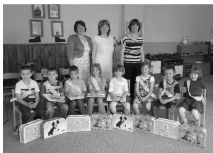
Slavnostní rozloučení s budoucími prvňáčky v Mateřské škole ve Starém Smolinci.