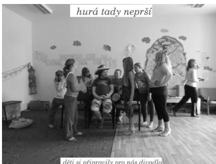
hurá tady neprší