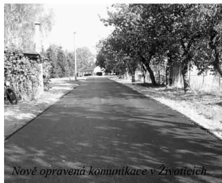
Nově opravená komunikace v Životicích