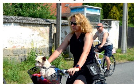
Nejmenší účastník se už od startu jen vezl

Neboť ve všech projížděných obcích vyvěšoval plakátky s pozváním na pátek 8. července, kdy byla na nezdřevském hřišti produkce Kinematografu Pavla Čadíka. K vidění byl poslední český film Miloše Formana Hoří, má panenka. Bohužel tentokrát se diváci museli obejít bez několika málo závěrečných minut, protože přírodní živel, konkrétně velmi silný vítr ohrožoval promítací plátno, a tak bylo představení předčasně ukončeno.