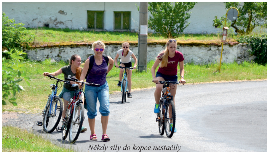
Někdy síly do kopce nestačily