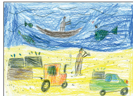
Obrázek Ondřeje Urbance z 2. ročníku