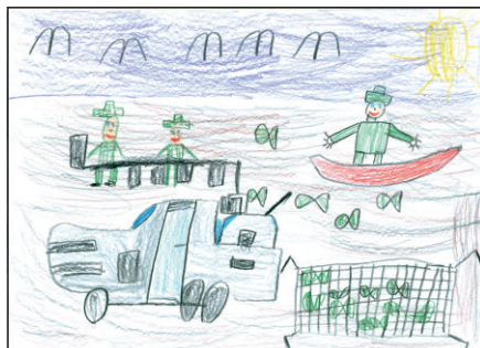
Obrázek Zdeňka Stupky z 2. ročníku