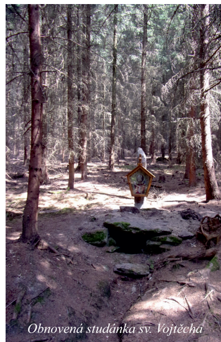
Obnovená studánka sv. Vojtěcha

Město Kasejovice a Český svaz chovatelů v Kasejovicích pořádají v pátek 28. 9. 2018 od 14 hodin v areálu chovatelů