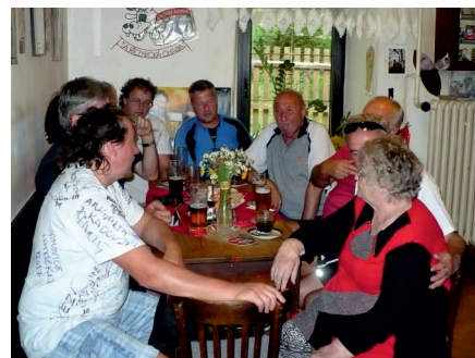
Příjemné posezení v Pozdyni