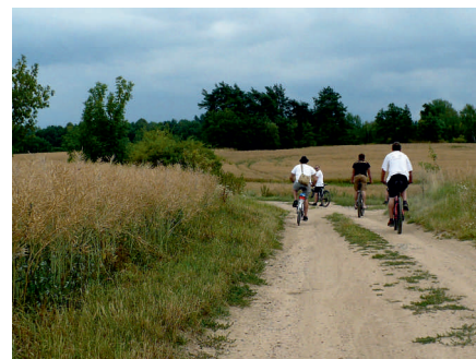
Pro jednoho z cyklistů osudné místo – doprava jezdit neměl