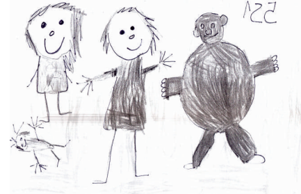
Záchranář, nakreslila Eva Chlandová