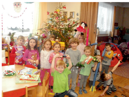
Pod stromečkem u Vodníčka

Adventní tvořeníčko nám připomnělo blížící se Vánoce. Společně s rodiči si každoročně vyrábíme různé vánoční dekorace na dveře, do pokojíčku na okno, nebo na stůl. Tentokrát to byl