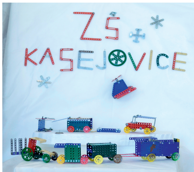
Hromadná nehoda na D1