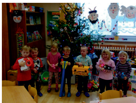
Pod stromečkem u Žabiček

s vánoční besídkou. Ještě vyzdobit třídy, stromeček, napečené cukroví od maminek a už můžeme začít! Všichni jsme předvedli, co jsme se do Vánoc naučili, veselé básničky, písničky, zahráli jsme pohádku „O neposlušných kůzlatech“ a společný zpěv koled. Závěrem jsme rodičům popřáli krásné Vánoce a předali vyrobené andělíčky. Vánoční atmosféru doplnila vůně cukroví, kávy, čaje, spokojené povídání rodičů a veselý smích. Na závěr jsme si všichni popřáli hezké vánoční svátky, ani se nám nechtělo domů. Maminkám moc děkujeme za vánoční cukroví, které napekly a přinesly na slavnostně ozdobené stolečky.