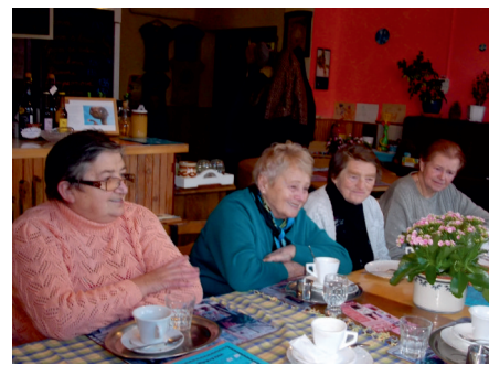
Vánoční večer si uspořádali také členové Klubu seniorů Babi léto