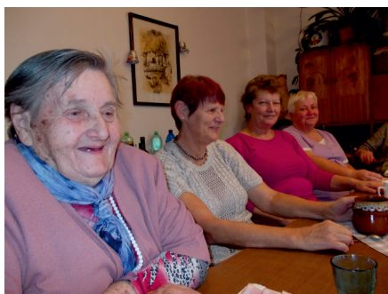
Společné vánoční posezení Klubu kasejovických žen a obyvatel DPS Kasejovice.