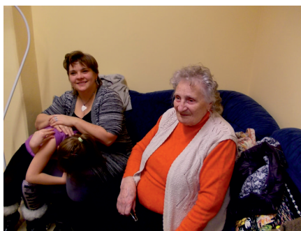
Návštěva Klubu kasejovických žen v domově pro seniory v Blatné