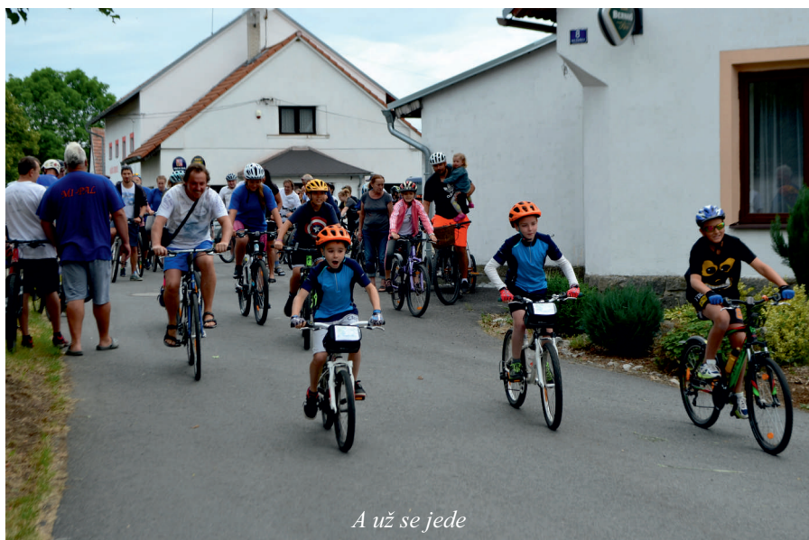
A už se jede