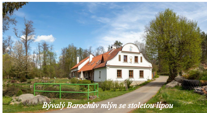
Bývalý Barochův mlýn se stoletou lípou

Od mlýna Barochů přijdeme na hlavní silnici a dáme se doleva. Po 180 m odbočíme vpravo loukou k myslivecké kazatelně a dále podél lesa vlevo přijdeme na lesní cestu. Ta nás