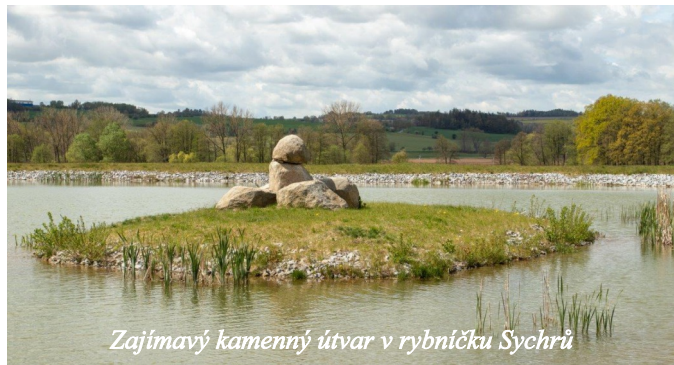
Zajímavý kamenný útvar v rybníčku Sychrů

Za Předmíř odbočíme vpravo (8) na vozovou cestu. Cesta se po 550 m stáčí (9) doprava k Hornímu Mlýnu a v našem, tedy jižním směru, už pokračuje jen jako vyšlapaná pěšina na kraji louky. Z tohoto místa se nejprve zajdeme podívat 300 m vlevo podél stromy porostlé vodoteče na nově založený rybník Sychrů (10). V rybníce byl zbudován ornitologický ostrůvek se zajíma-