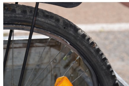
Následky osudného defektu