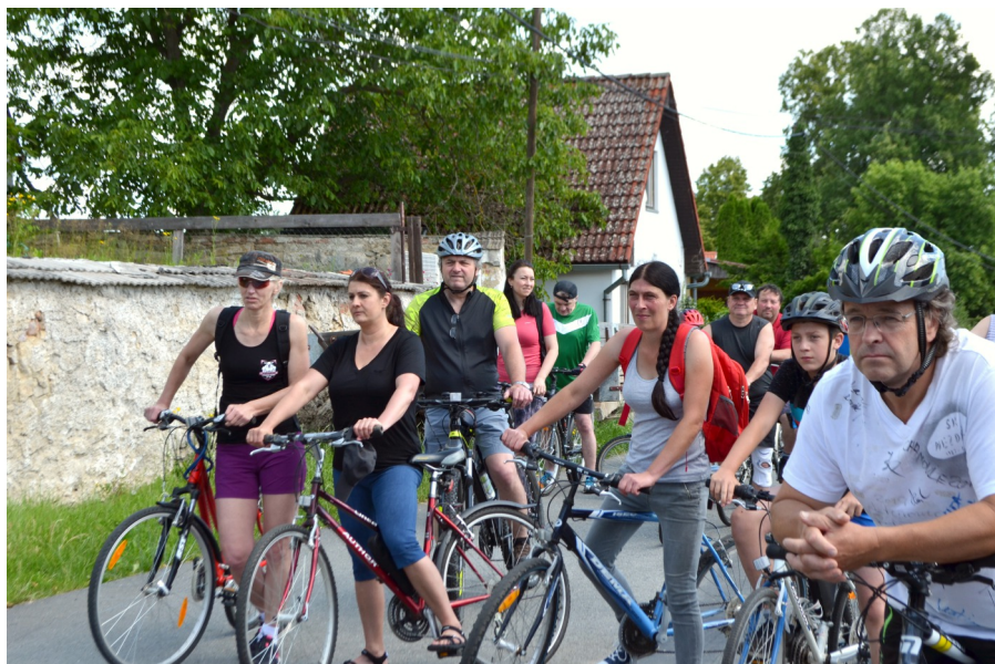
Napětí před startem, foto Viktor Jandera