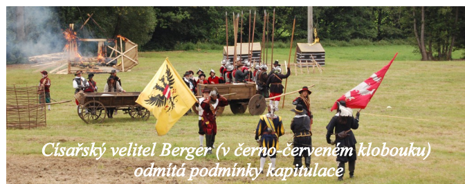
Císařský velitel Berger (v černo-červeném klobouku) odmítá podmínky kapitulace