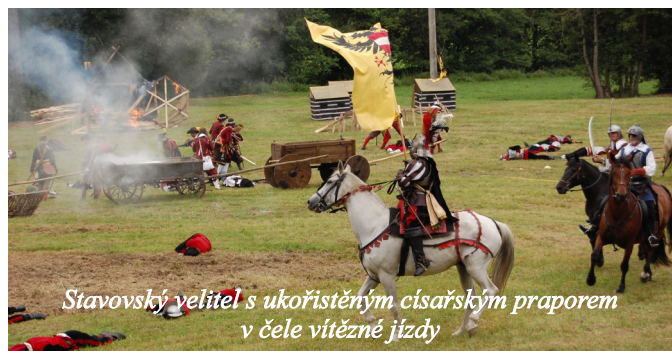
Stavovský velitel s ukořistěným císařským praporem v čele vítězné jízdy