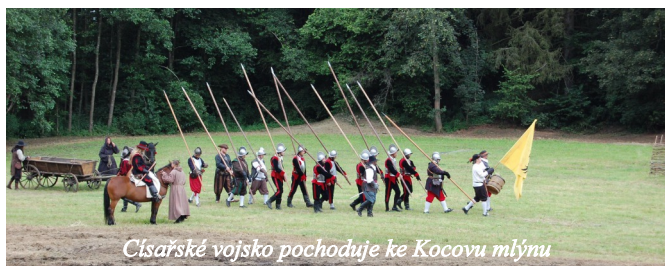
Císařské vojsko pochoduje ke Kocovu mlýnu