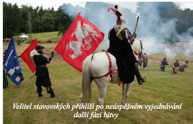
Velitel stavovských přihlíží po neúspěšném vyjednávání další fázi bitvy