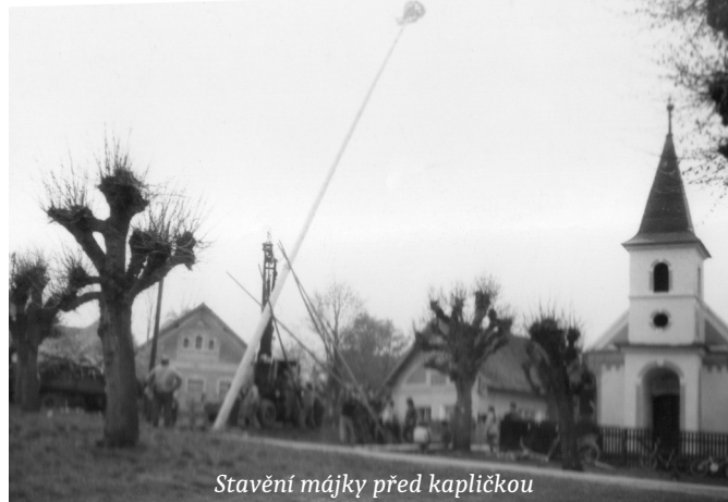
Stavění májky před kapličkou