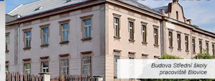
Budova Střední školy pracoviště Blovic