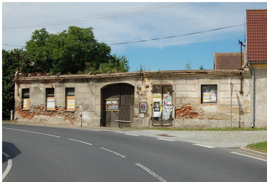
Dům čp. 144 po odstranění střechy (foto autor článku, červenec 2017).

Po domech čp. 41 a 42 na Jánském náměstí, které byly jako značně sešlé zbořeny v září 2017, se nyní stal minulostí také dům čp. 144 v západním cípu takzvaného Kozího plácku. I on byl dlouhodobě neobýván a neudržován. K jeho chátrání přispívala rovněž poloha bezprostředně vedle hlavní silnice s velmi frekventovaným provozem. Charakteristickým bylo, že sloužil i jako neoficiální veřejná plakátovací plocha. V roce 2017 musela být snesena střecha a krov, aby opadávající materiál neohrožoval dopravu a chodce. K demolici zdiva obytných a hospodářských budov přikročil majitel v posledních dvou lednových týdnech tohoto roku. Zachována zůstala pouze stodola při čp. 217.