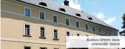
Budova Střední školy pracoviště Oselce