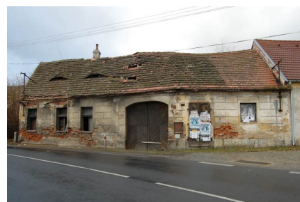
Dům čp. 144 před odstraněním střechy (prosinec 2016).