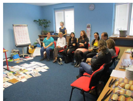
Akce MAS - Seminář Škola v pohodě