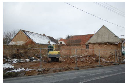
Zbořeniště domu čp. 144.