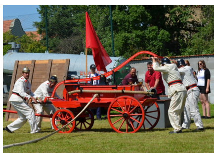
Historická stříkačka v akci