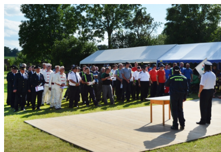
Závěrečný nástup všech družstev