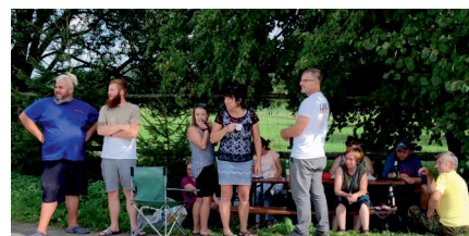
Pozorní diváci viděli jen jediný úspěšný lov