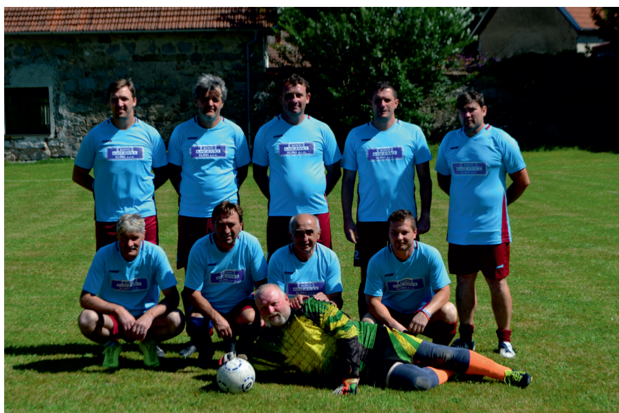
Vítězná Stará garda Kasejovice, foto Viktor Jandera

Sobota 14. srpna byla docela žhavá, a tak se fotbalisté na tradičním nezďrevském turnaji vůbec nezlobili, že pořadatelé trochu zúžili už tak dost malé hřiště. Dva zápasy skončily nerozhodně, a proto musely rozhodnout penalty. Při nich prokázala své schopnosti Stará garda Kasejovice. Nejdříve porazila po nerozhodném výsledku 1-1 spojený tým Oujezda a Řesanice 4-2, který prohrál i druhý zápas s domácím SK 2-1. Ve finále, které skončilo 2-2, pak nad Nezdřevem na penalty zvítězila 3-0.