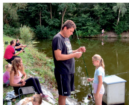
Ani pečlivá příprava návnady nebyla nic platná