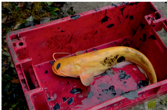
Bílý sumec byl pochopitelně do rybníka vrácen