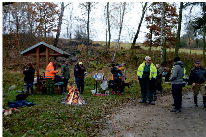
U spodní Štěrbinu nebyla o občerstvení nouze