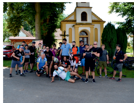
„Varhanova” skupina ve Vrbně

Začátek července je pro mnoho desítek cyklistů povellem vyrazit z Nezdřeva, projet zhruba desítkou vesnic a půvabnou krajinou a vrátit se na místo startu.