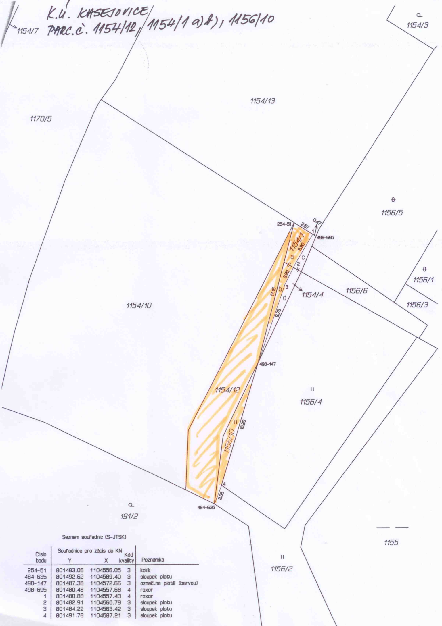
Seznam souřadnic (S-JTSK)

K.ú. KASEJOVICE PARC.č. 1154/12, 1154/1 a) #), 1156/10